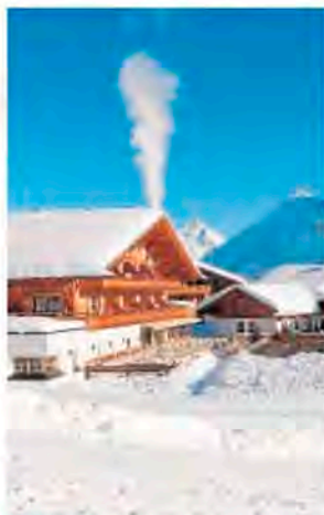
The Burg, entre montañas austriacas