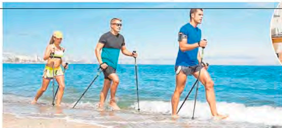
Marbella Club Hotel organiza diferentes actividades al borde del mar, como marcha nórdica