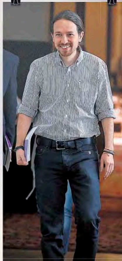
Pablo Iglesias | Podemos

«Para este gobierno no hace falta ni que C's esté. Ni pintamos nada ni queremos estar»