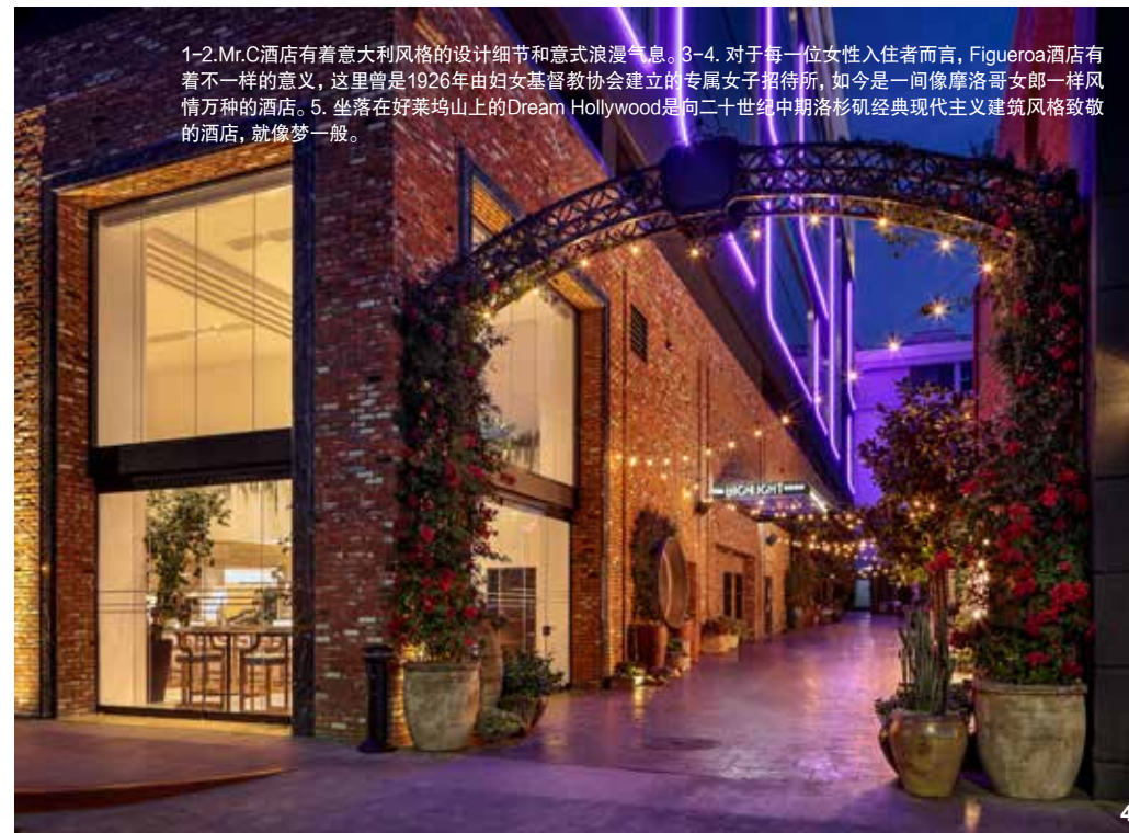
1-2.Mr.C酒店有着意大利风格的设计细节和意式浪漫气息。3-4. 对于每一位女性入住者而言，Figueroa酒店有着不一样的意义，这里曾是1926年由妇女基督教协会建立的专属女子招待所，如今是一间像摩洛哥女郎一样风情万种的酒店。5. 坐落在好莱坞山上的Dream Hollywood是向二十世纪中期洛杉矶经典现代主义建筑风格致敬的酒店，就像梦一般。

上的Dream Hollywood酒店或许是最符合好莱坞主题的酒店之一了吧，这座向二十世纪中期洛杉矶经典现代主义建筑风格致敬的酒店，就像梦一般。