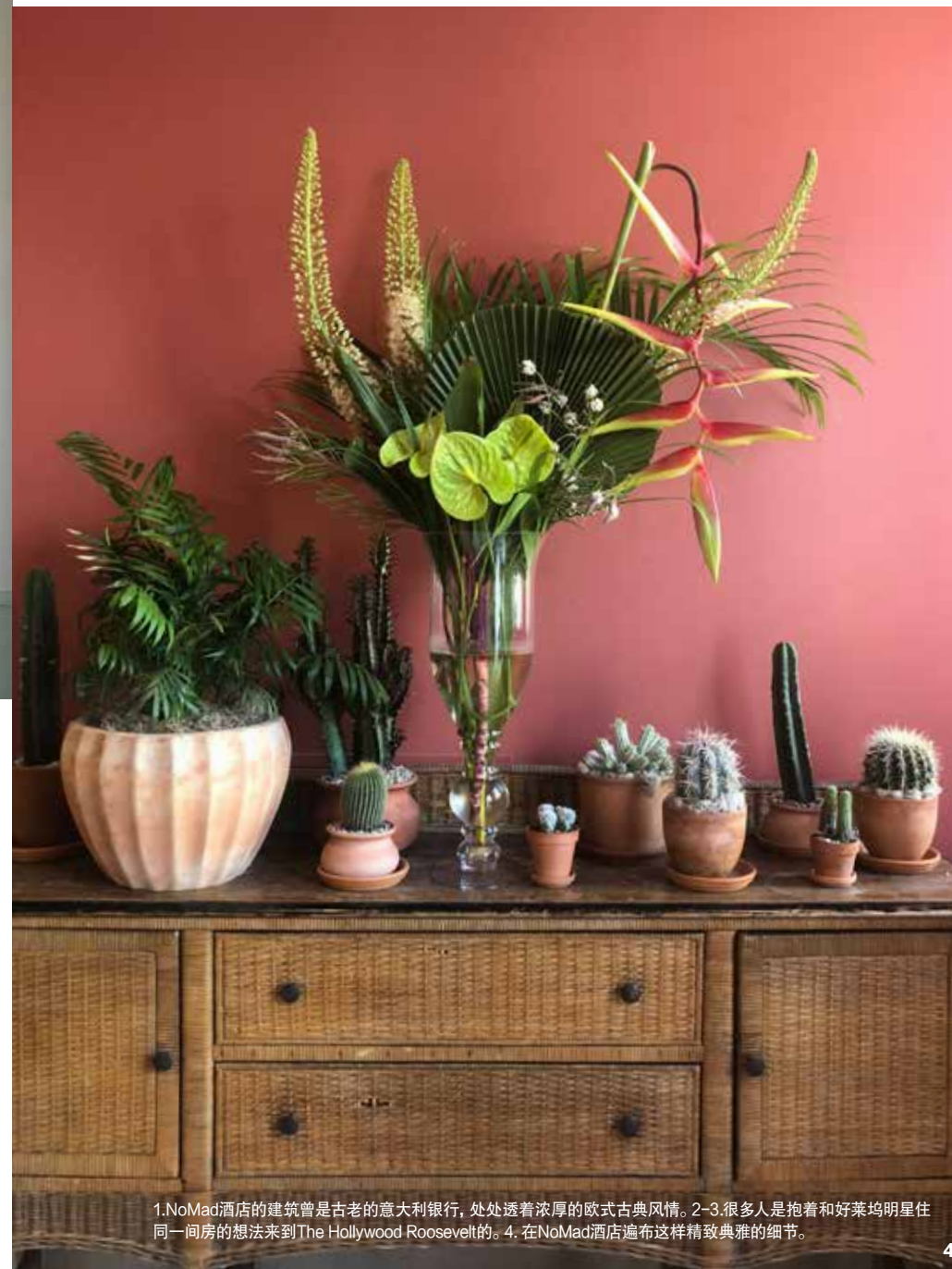
1.NoMad酒店的建筑曾是古老的意大利银行，处处透着浓厚的欧式古典风情。2-3.很多人是抱着和好莱坞明星住同一间房的想法来到The Hollywood Roosevelt的。4. 在NoMad酒店遍布这样精致典雅的细节。