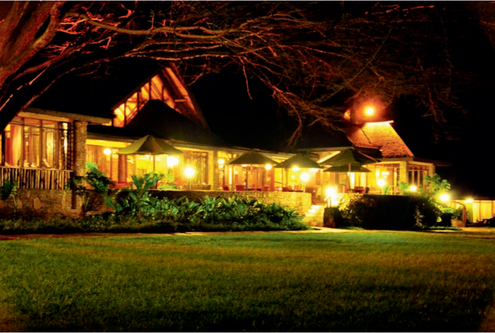
Keekorok Lodge 是一个真正意义的丛林奢华酒店，与野生动物仅一门之隔，对孩子来说很方便。就连就餐地亦是很方便地观赏野生动物，更有马赛武士站岗

St. Regis Hotel over the world has a unique family treatment and provides extraordinary experience beyond your expectations. It also provides more choices for parent-child trip families. Like the iconic Regis butler service, Regis family decorum is also a characteristic that shows personalized service of Regis, which aims to provide a series of personalized customization service and wonderful experience activities for family tourists.