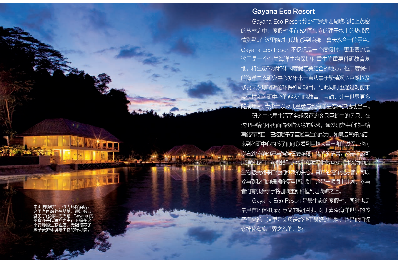
本页图顺时针：作为环保酒店，这里有巨蛤养殖基地，通过努力避免了此物种的灭绝；Gayana 的美食亦是以海鲜为主；下榻在这个安静的生态酒店，无疑培养了孩子爱护环境与生物的好习惯。

Gayana Eco Resort 是最生态的度假村，同时也是最具有环保和探索意义的度假村。对于喜爱海洋世界的孩子们来说，这里是父母送给他们最好的礼物，也是他们探索神秘海底世界之旅的开始。