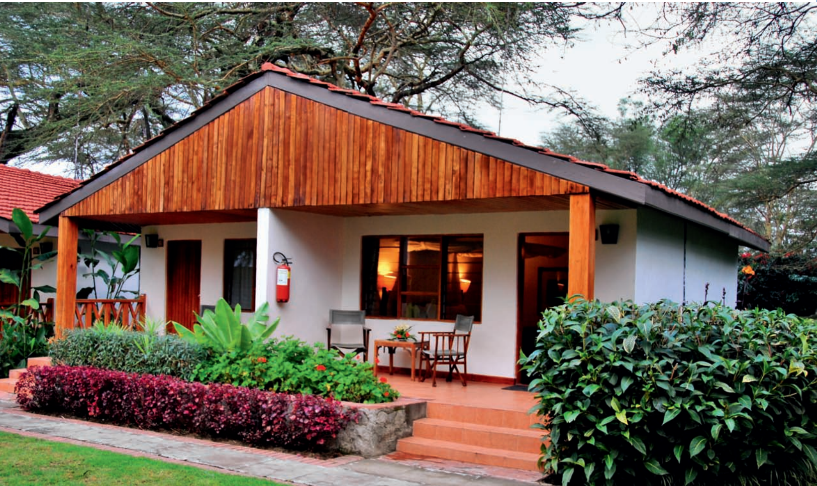
Lake Naivasha 既是一个观赏自然生态风光的下榻地，亦有着丰富的历史文化特色。

纳瓦沙湖中鱼类资源十分丰富，垂钓是纳瓦沙湖非常有趣的一个活动，游客可以在湖边平地上搭建帐篷，花一整天的时间静静享受垂钓带来的乐趣。纳瓦沙湖附近就是著名的地狱之门国家公园，自然景观独具特色，并且有非常丰富的野生动物储量，吸引了众多前往肯尼亚旅游的游客。在地狱之门国家公园进行一场酣畅淋漓的游猎之后，不妨来到纳瓦沙湖舒适地静静感受这里美丽的景色。