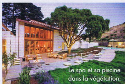
Le spa et sa piscine dans la végétation.

Rens. sur le site San Francisco Travel : sftravel.com